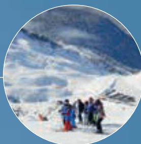
138 km para esquí y 'snowboard'