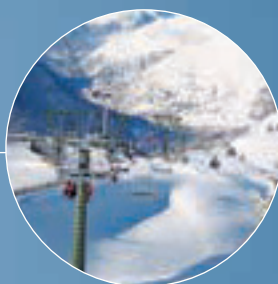
120 km de pistas balizadas y pisadas

La nueva aplicación para smartphones permite acceder a todos los contenidos de la página web www.baqueira.es en cualquier momento y lugar de manera fácil y rápida. El esquiador podrá conocer qué remontes están en funcionamiento, qué pistas están abiertas y cuáles recién pisadas, a la vez que tendrá acceso a la previsión meteorológica del día. La aplicación también ofrece la posibilidad de conectar en directo con las webcams de Baqueira y la Val d'Aran y de escuchar los podcasts de la radio de la estación Radio Aran FM 91.0. En la página web se ha incorporado la propuesta de tres itinerarios por toda la estación, con información muy completa sobre las instalaciones y los servicios que se encuentran en el recorrido. Además, ya están disponibles en Google Streetview las imágenes de todas las pistas de Baqueira Beret.